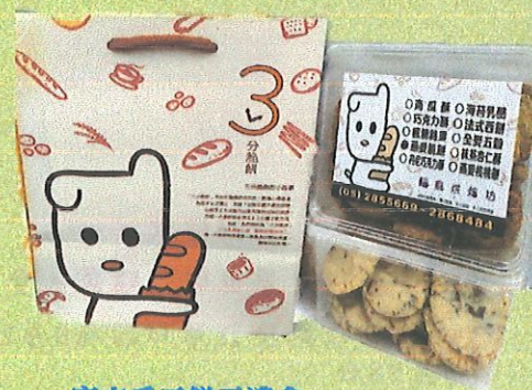
麻吉手工餅乾禮盒