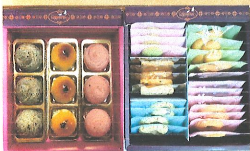
富貴禮盒 上、下兩層